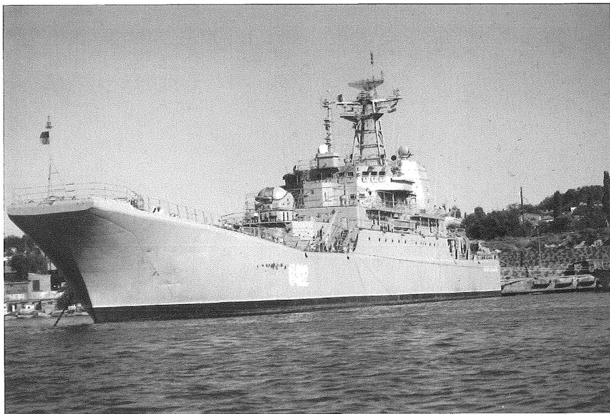
La nave appoggio U 402 Konstantin Olshanskij

dell'identificazione. Notiamo un mezzo relitto parzialmente ricostruito come cacciatorpediniere a quattro fumaioli, tipico della prima guerra mondiale. L'identificazione rimane un mistero anche dopo tentativi fatti a casa consultando i soliti almanacchi navali (un "caro" amico azzarda l'ipotesi che si tratti di un relitto qualunque trasformato in cacciatorpediniere per un film). Il battello costeggia il lato di nordest della stessa baia passando davanti alla stazione dei sommergibili: ce ne sono due, l' Alrosa ed un altro in bacino che non si riesce ad identificare se non come appartenente alla "classe Romeo". Entriamo finalmente nella grande baia settentrionale dove ci aspettano le grandi unità in servizio attivo nelle due marine conviventi, tra esse il russo Moskva e l'ammiraglia ucraina Konstantin