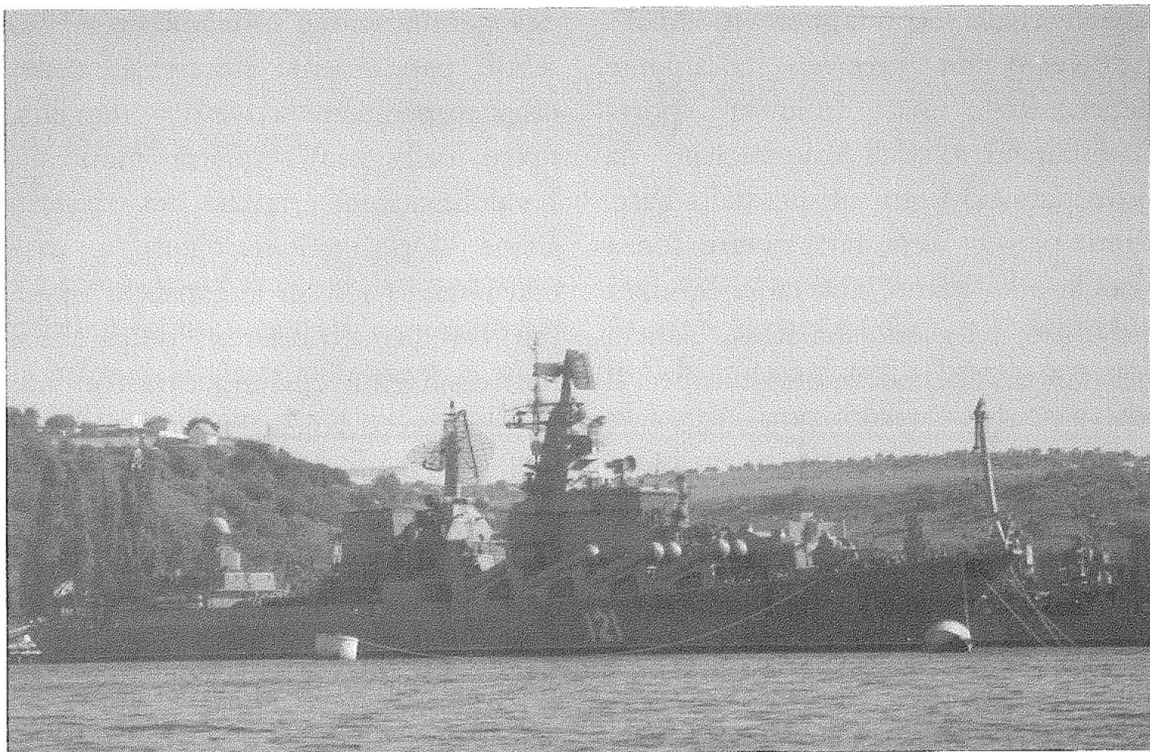
L'unità lanciamissili Moskva

Olshanskij , i catamarani ucraini tipo "Bora" ed altre. Il battello inverte la marcia defilando accanto alla boa n.3