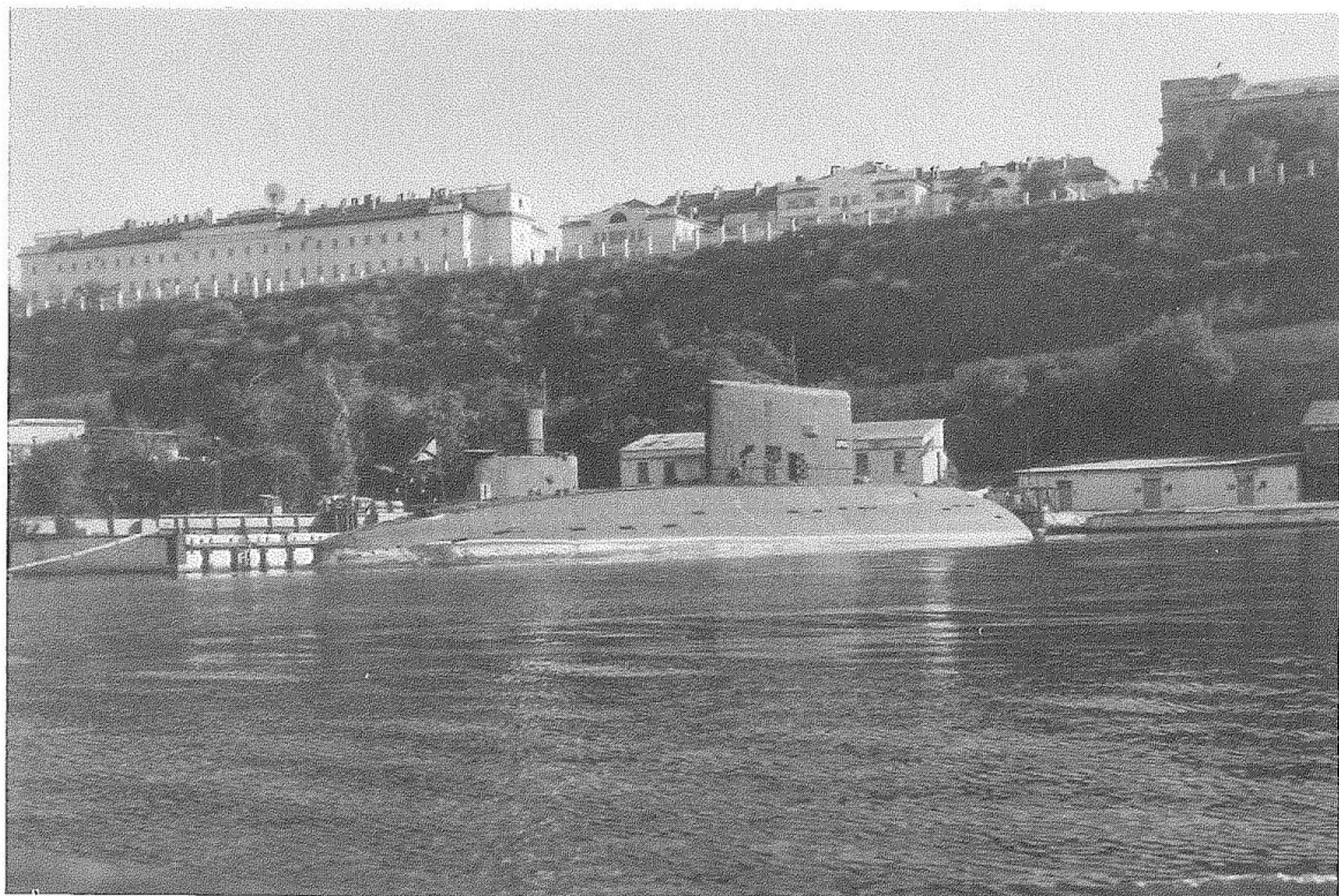
Il sottomarino Arosa – dietro un battello della classe “Romeo”