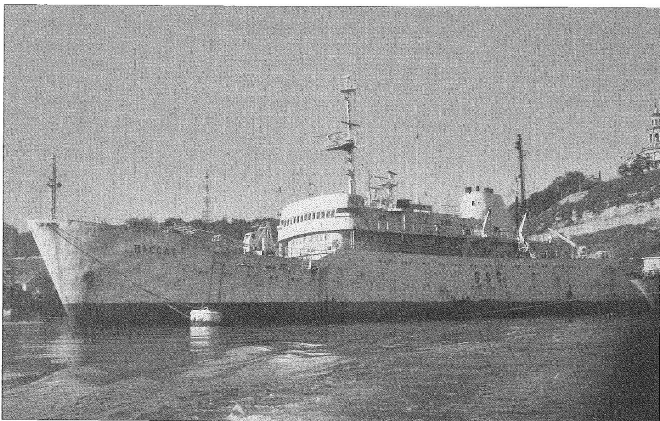
La nave idrografica Passat in disarmo